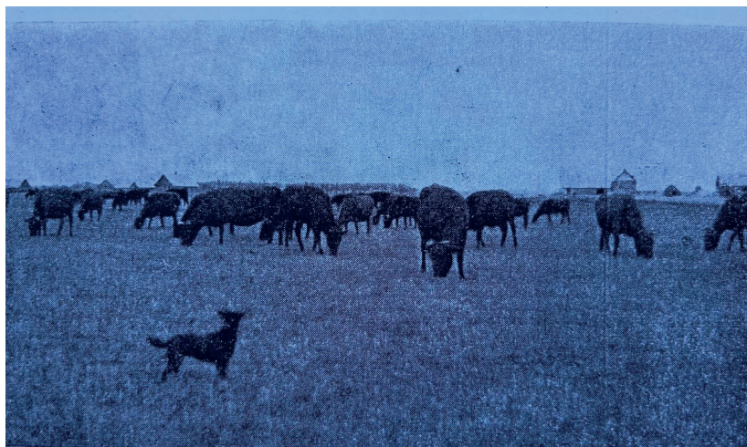
Иллюстрация 124. Стадо на мызе Паниковичи.

Помимо вышеупомянутых промышленных отраслей, в этой области есть один кирпичный завод, два прядильно-шерстичесальных завода в Лаврах, 4 лесопилки, одна паровая мельница, одна ветряная мельница и электростанция в посёлке Лавры. В качестве домашней ручной работы изготавливают деревянную посуду: корыта, стулья, вёдра, бочки. Их продают на ярмарках.