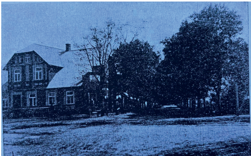
Иллюстрация 121. Бульвар в посёлке Лавры.

четверть всех хуторов. Это не может не оставить своего влияния на общее сельскохозяйственное развитие.