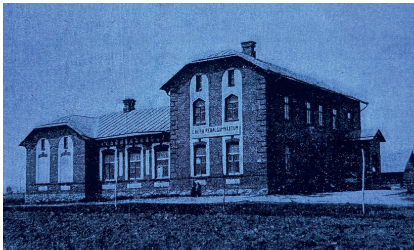
Иллюстрация 114. Частная общеобразовательная гимназия в посёлке Лавры.

ли — в школе 3 класса, 2 учителя, 56 учеников; Литвиново — в школе 4 класса, 2 учителя, 72 ученика; Луги — в школе 4 класса, 1 учитель, 24 ученика; Ротово эстонское отделение — в школе 4 класса, 1 учитель, 17 учеников; Ротово русское отделение — в школе 4 класса, 2 учителя, 83 ученика; школа в Sõretski (назв. местности) — 4 класса, 2 учителя, 72 ученика; Веселкино — в школе 4 класса, 2 учителя, 50 учеников.