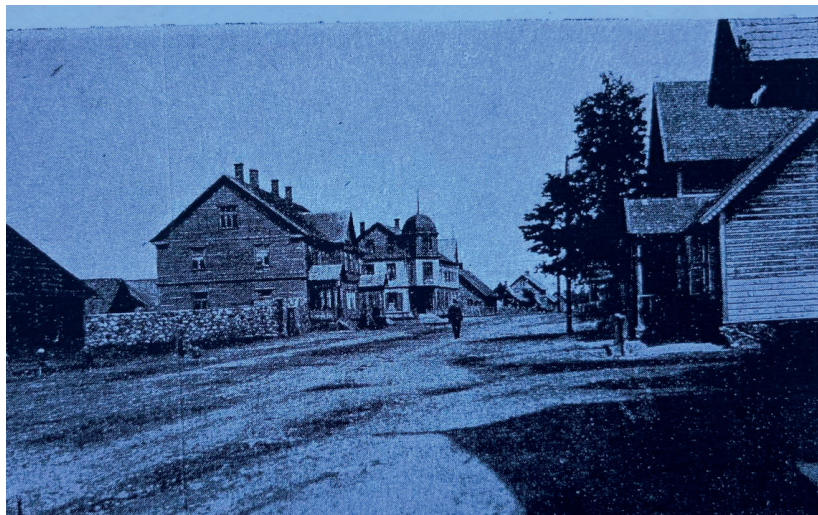
Иллюстрация 117. Посёлок Лавры.

линий определяются с севера на юг. Длинными полосами в одном направлении тянутся поля на вершинах невысоких порогов, рядом с ними в длинных ложбинах на влажной почве леса и кустарники. Дороги также следуют направлению поверхностного ландшафта, а хутора расположены в одном направлении в виде рядовых и цепных деревень.