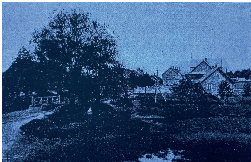
Иллюстрация 115. Река Лидва возле поселка Лавры.

от болота Ползохново. К югу от Лидва находится еще одна более маленькая река того же направления, Месгушка, которая, начиная с волости Лавры между Большие-Кикуты и поселком Никольская (ныне д. Ключище) вдоль дороги Лавры-Кудеб, впадает в Кудеб под Шумилово-Пыльгино.