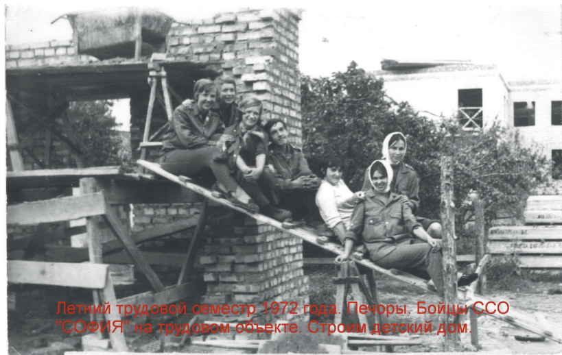
Летний трудовой семестр 1972 года. Печоры. Бойцы ССО "СОФИЯ" на трудовом объекте. Строят детский дом.

— Девушек и женщин в брюках не пропускал дежурный монах у ворот, но я прошла! Видимо, мой внешний облик позволил монаху принять меня за молодого парнишку!