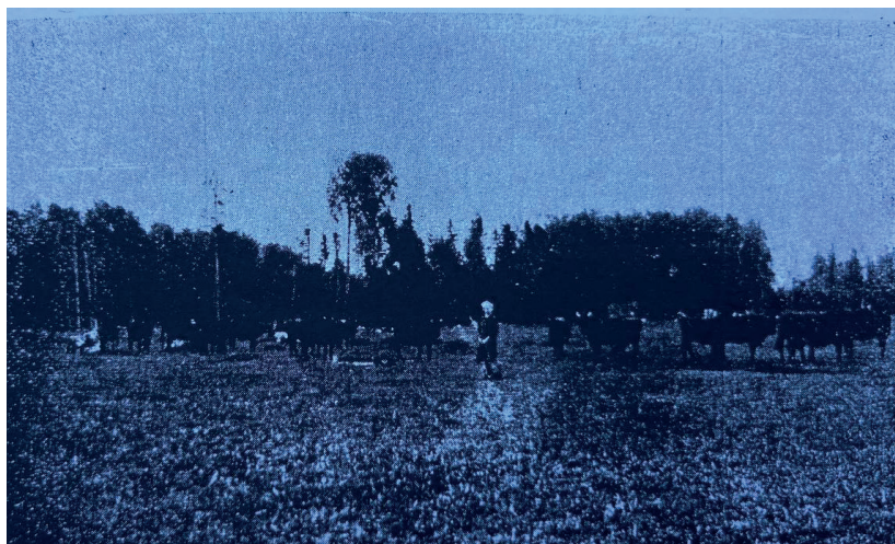
Иллюстрация 123. Стадо хутора P. Laats в деревне Лабково волости Ротово.

В целом заметен быстрый прогресс в сфере скотоводства, чему во многом способствует более высокое экономическое процветание волости Лавры, конечно, по сравнению с другими частями Сетумаа.