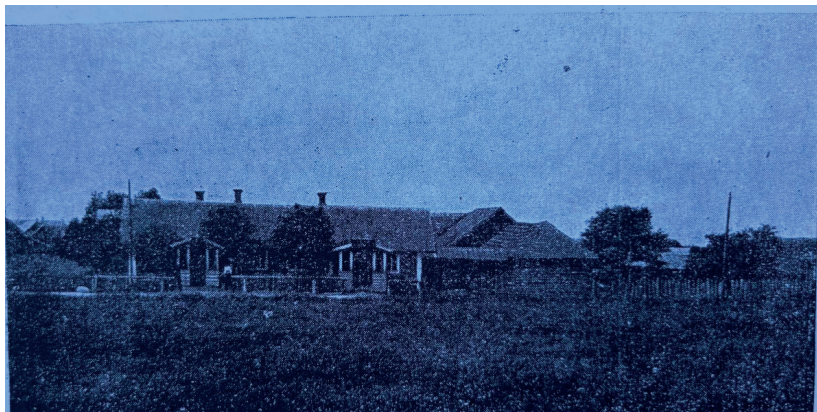
Иллюстрация 120. Латышский хутор в деревне Шемерицы волости Лавры.

В поселке Лавры есть от деревенских строений отличительные здания, крупные здания городского характера, такие как двухэтажное кирпичное здание реальной гимназии и другие, среди жилых домов много мансардных зданий с высокими потолками. Обильные насаждения в виде бульваров (иллюстрация 121) и парков разнообразят внешнюю границу поселка. Также на южной окраине поселка протекает река Лидва.