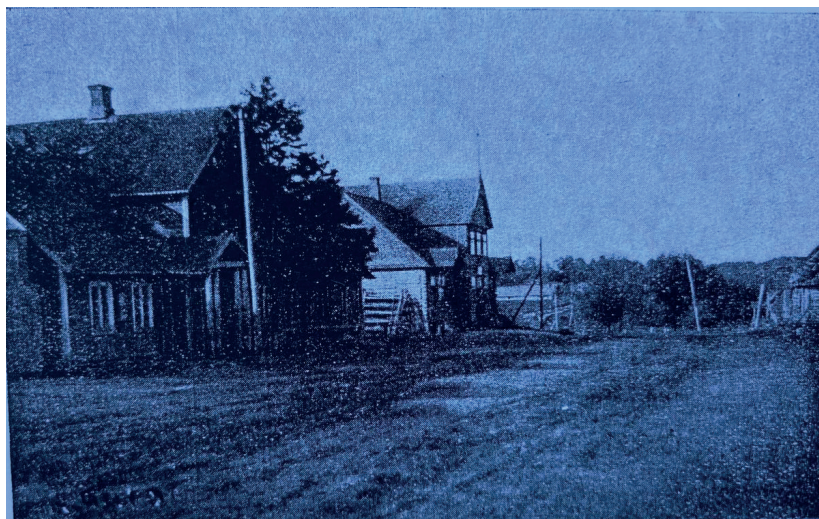
Иллюстрация 119. В поселке Лавры.

ми домами и без упорядоченного плана, где дома сгруппированы вместе. Это может быть связано, с одной стороны, с соседством уездов Эстонии и Латвии, которые послужили примером, но в первую очередь, вероятно, с неровным рельефом, препятствующим образованию крупных уличных деревень, где дома были бы плотно расположены по обе стороны дороги. Таким образом, ареал отдельных дворов и небольших деревень с разбросанными домами и без упорядоченного плана, где дома сгруппированы вместе находится в западной части волостной группы.