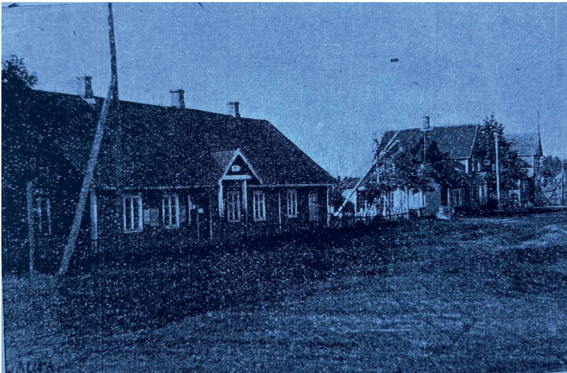
Иллюстрация 118. В поселке Лавры.

Хутора и деревни латышей в обеих волостях расположены вперемешку с русскими поселениями. Также и эстонские хутора. Кроме того, больше всего эстонцев в поселке Лавры.