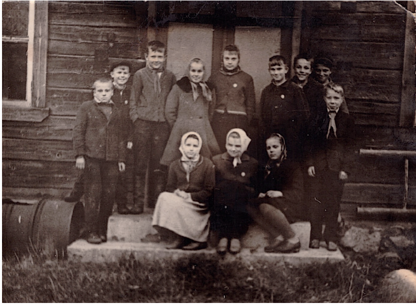
Ученики Лезговской начальной школы, 1952 год